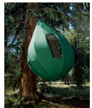
Misjiens in 'ne Treetent?